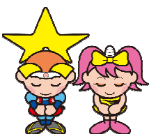
岡山県マスコット ももっち・うらっち